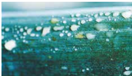
パフォームCa 500倍 加用