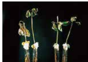
無散布 B剤 400倍