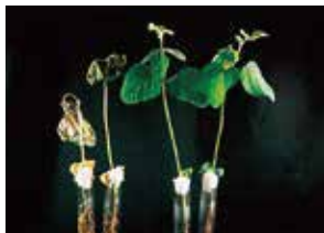
無散布 パフォームCa 400倍