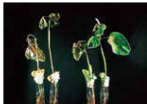
無散布 A剤 300倍