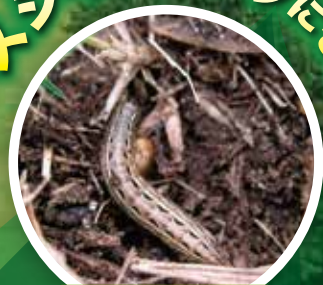
スジキリヨトウ 幼虫